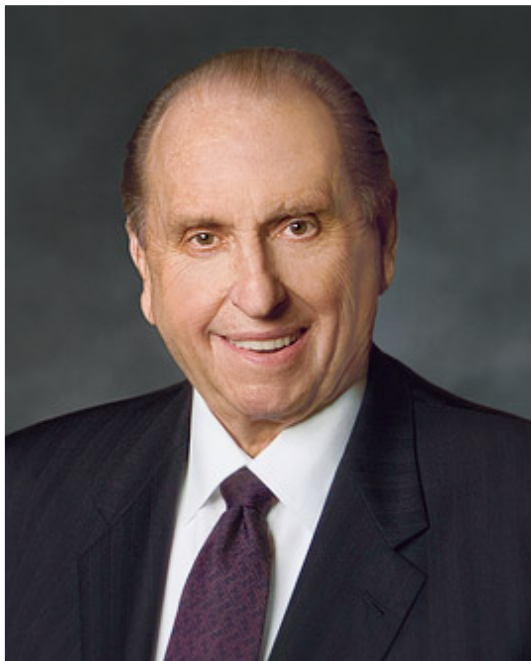
Tomas S. Monson, "Jini një Shembull dhe një Dritë", Ensign dhe Liahona, nëntor 2015