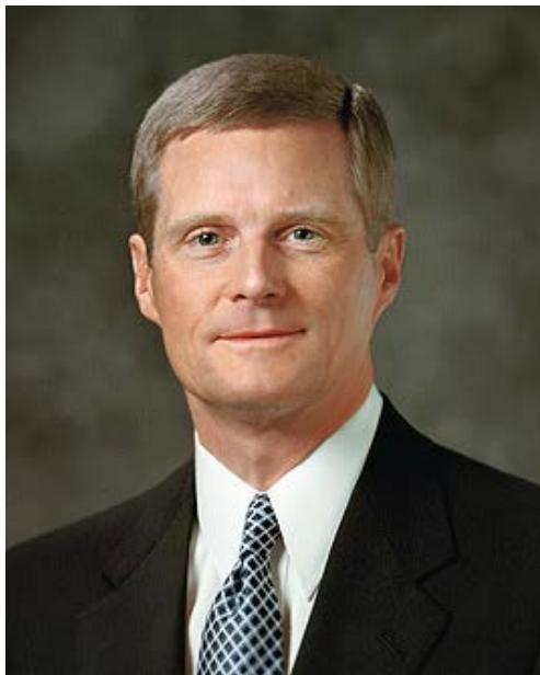
David A. Bednar, "Light the World", Ensign, dhjetor 2016