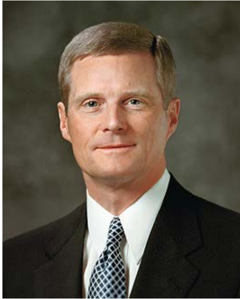
David A. Bednar, "Light the World", Ensign, dhjetor 2016